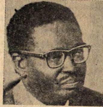
Doktor AGOSTINO NETO : MPLA lideri Angola halkının tek ve gerçek temsilcisi MPLA, siyasal ve ekonomik bağımsızlık hareketini yürütüyor.

Sosyalist sistem Angola halkının emperyalizme ve kapitalizme karşı yürüttüğü savaşı destekliyor. Sovyetler Birliği büyük maddi yardımlar yaparak, Küba gönüllü asker göndererek Angola'nın kurtuluş hareketinin yanında yer alıyor.