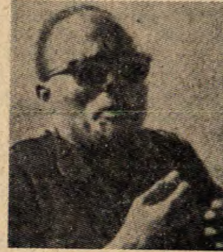
HOLDEN ROBERTO : FNLA lideri (Amerikan CIA teşkilatı adına çalışan bir ajan) FNLA, Angola'nın kurtuluş hareketini saptırmaya uğraşiyor.

ce Forumu» yapıldı. Forumda CHP'nin fikir ve düşünce yapısı tartışıldı. Bu arada CHP Genel Başkanı Bülent Ecevit de önemli bir konuşma yaptı. Ecevit işçi sınıfı hareketi üzerine görüşlerini açıkladı.