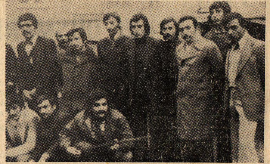
Kanat Plâstik işçileri toplu halde İŞÇİ DAVASI objektifine poz veriyor.

Bu arada fabrikanın sahibi Kartal (İstanbul)'a yeni bir fabrika yaptırmaya başlamış. Bomonti'deki fabrikayı kapatmaya hazırlanmış. İşçilerin DİSK'e geçmesine öncülük edenlerden başlayarak işçileri de 9 ar kişilik gruplar halinde işten atmaya hazırlanmış.