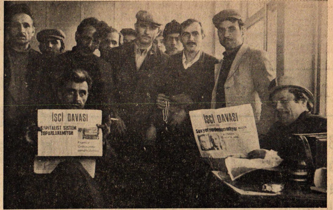
İşçi Davası'nın dostları gazetelerini okuyorlar.

İşçi Davası, bugüne kadar çıkan sayılarda birçok dünya meselelerini ele aldı. Birçok Türkiye meselesini açıkladı. İşçi Davası dedi ki; Dünya değişmektedir. Kapitalist sistem ile sosyalist sistem barış içinde yan yana yaşama politikasına geçmiştir. Bu «detant» politikasıdır. Bu politika son olarak Helsinki toplantısında noktalanmıştır. Demirel bile Detant'tan söz etmektedir. Türkiye sosyalist ülkelerle birçok anlaşmalar yapmaktadır. İşçi Davası çıkışından itibaren bu meseleye önem-