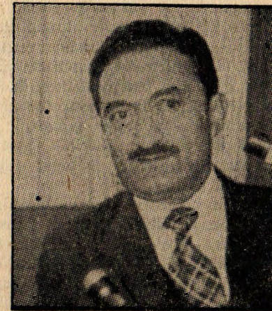
ECEVİT - İşçi sendikalarına çağrı yaptı.